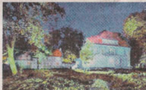
Eine „blaue Stunde“, festgehalten von Philipp Schumacher.